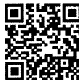
CoDi, el nuevo sistema de pagos

El programa piloto del IMSS para trabajadores domésticos tiene que enfrentar la inestabilidad laboral en este sector.