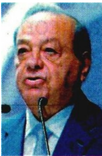
Carlos Slim Helú