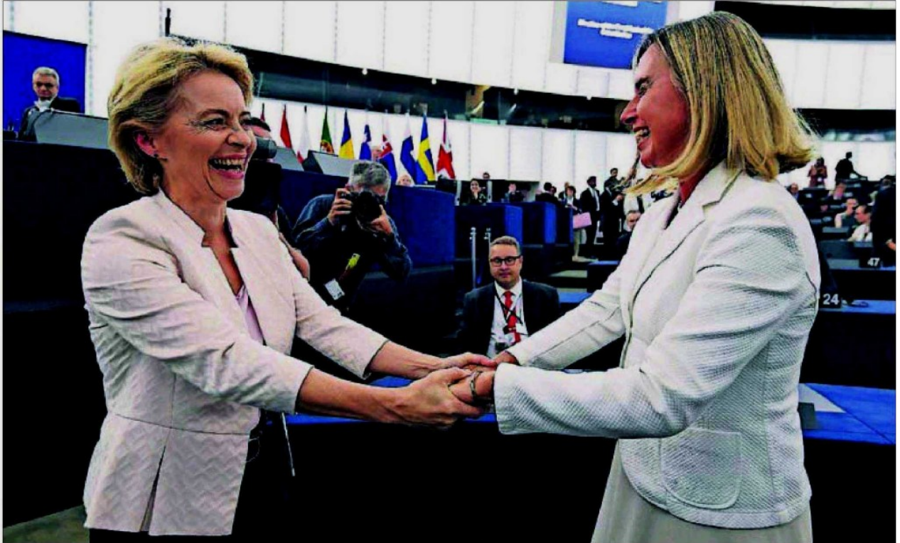
Federica Mogherini, jefa de la diplomacia europea (derecha), felicita a Von der Leyen tras la elección de esta al frente de la CE.