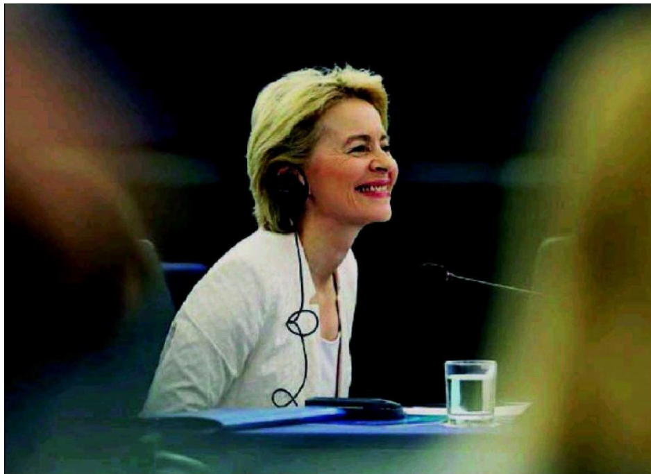
Ursula von der Leyen, ayer durante el debate en el Parlamento Europeo.