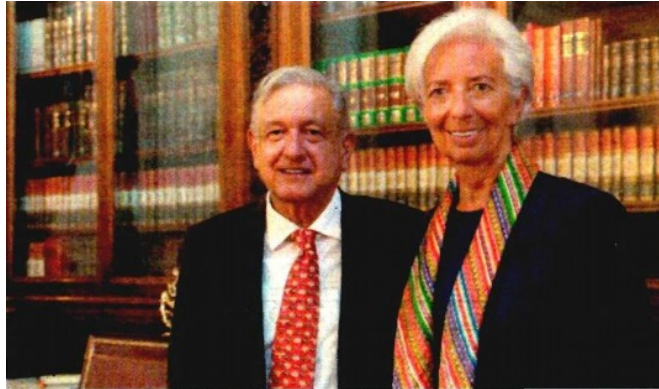
Andrés Manuel López Obrador y Christine Lagarde