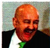
Carlos Salinas Presidente de México (1988-1994)