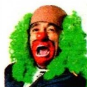
Brozo Víctor Trujillo, Brozo, difundió en El Mañanero el video del ex secretario de Finanzas de AMLO.