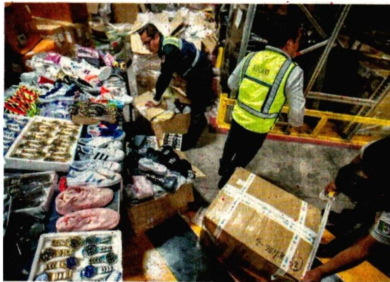
El último operativo en la Aduana del AICM se realizó en abril pasado, en el que se decomisaron 45 toneladas de mercancía apócrifa.