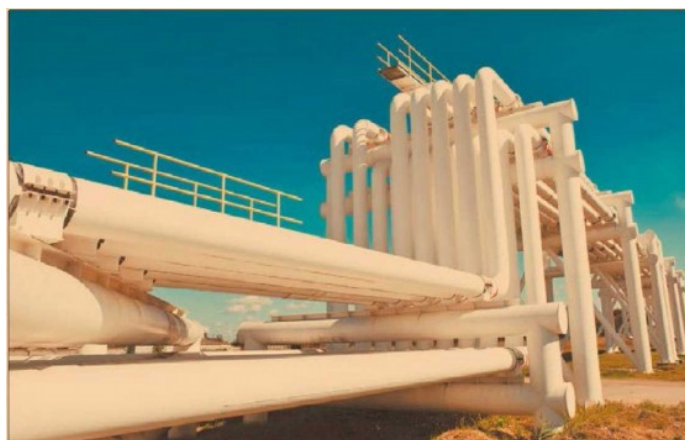
Analistas dicen que las emisoras tendrán mejor desempeño.