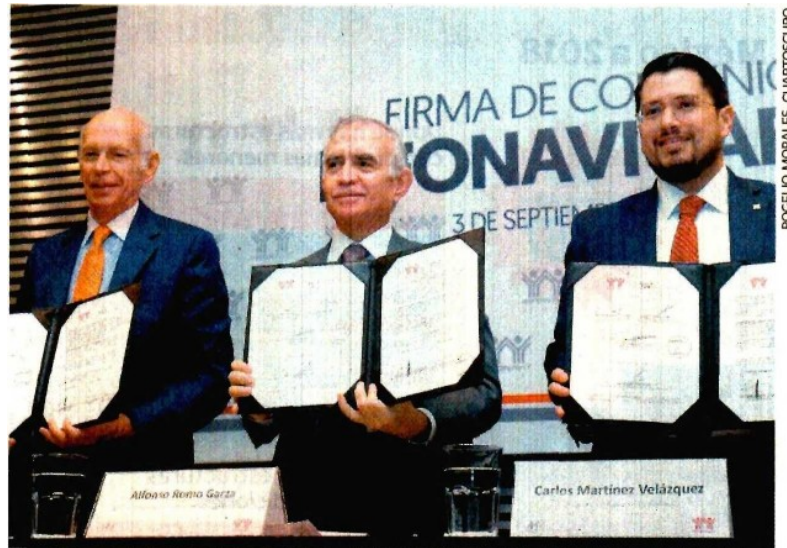
Durante la firma del convenio entre el Infonavit y la ABM se expuso que el acceso a la vivienda es prioritario para la banca del país.