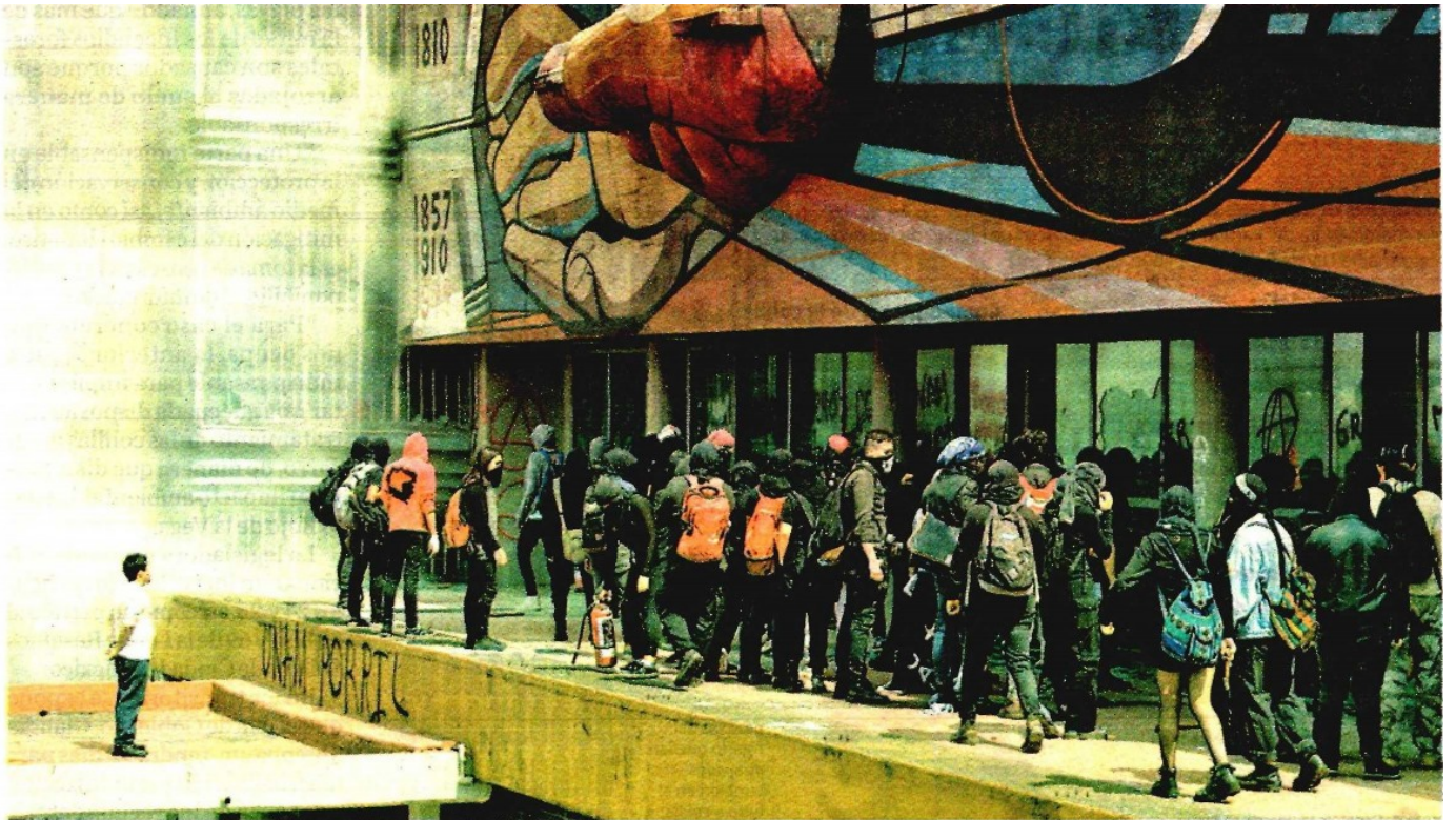
En su avance hacia el edificio principal, los agresores usaron piedras, palos y petardos.