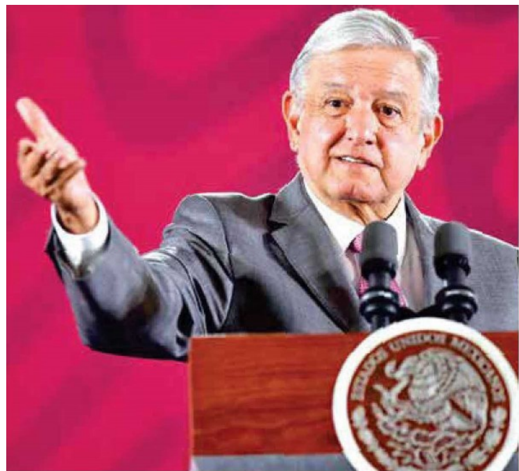
MENSAJE. Andrés Manuel López Obrador, ayer, en conferencia.

Reitero mi compromiso con la transformación del #PJF en beneficio de la gente, sobre todo de los más desprotegidos, de los olvidados, de los pobres, de las mujeres, de los indígenas, de los que no tienen quien alce la voz por ellos. Los jueces estamos para defender al más débil.