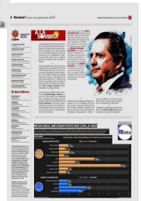
Gráfico: Rodolfo Gómez García