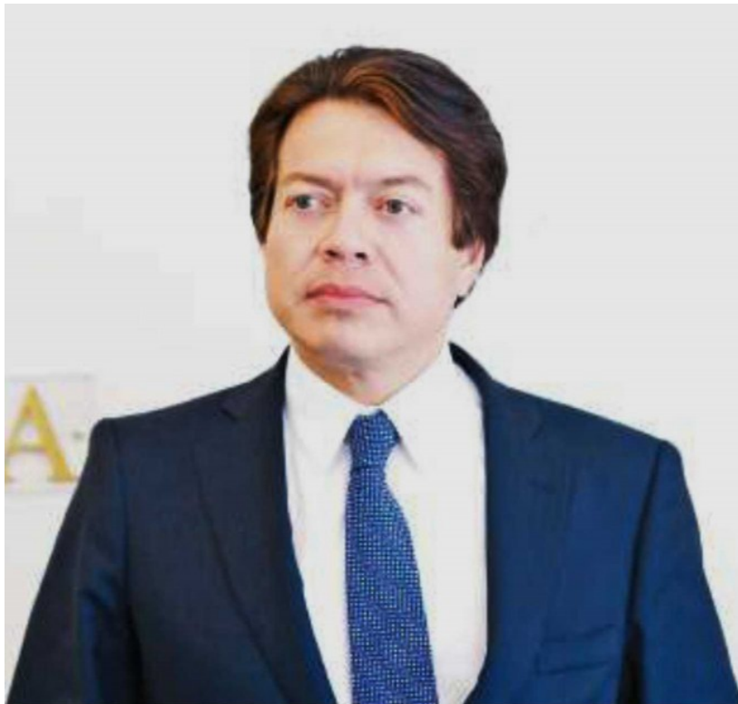
El diputado federal Mario Delgado lidera las encuestas para la dirigencia nacional de Morena . Especial