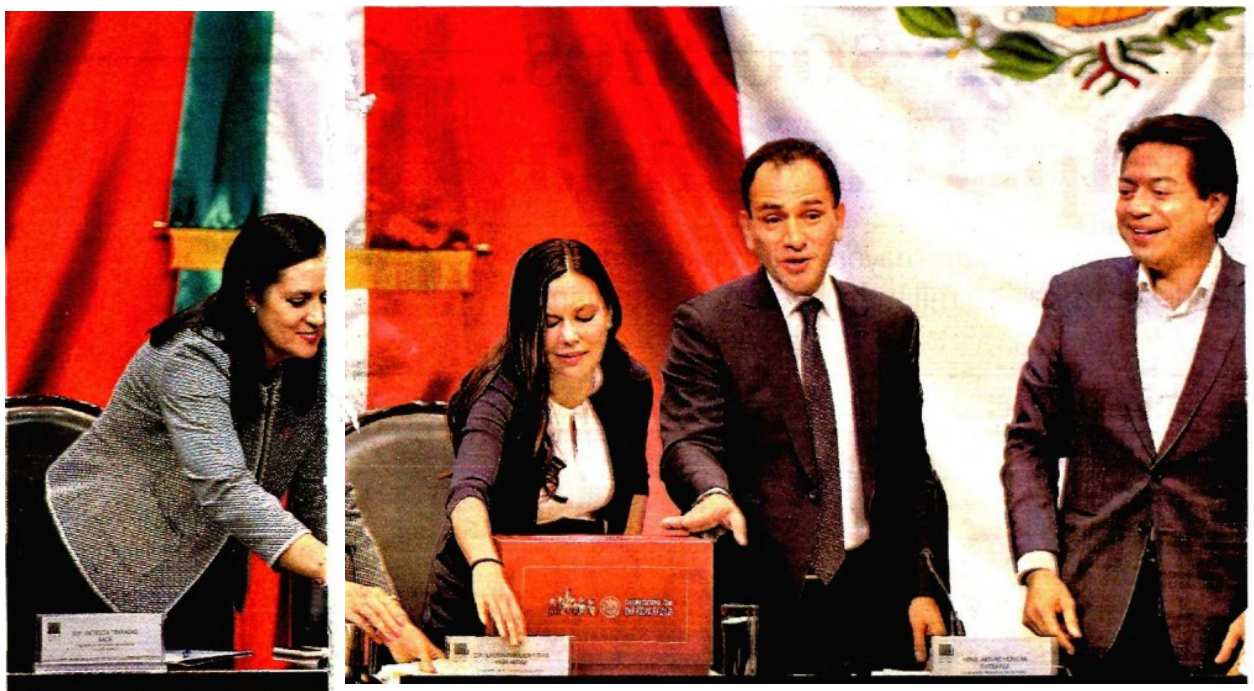
El funcionario federal acudió a San Lázaro a entregar la propuesta. HÉCTOR TELLEZ

En tanto, y con el objetivo de mantener la salud de las finanzas públicas ante posibles eventos adversos, el gobierno federal continuará con el programa de coberturas petroleras, así como con la acumulación de recursos en los fondos de estabilización. ■