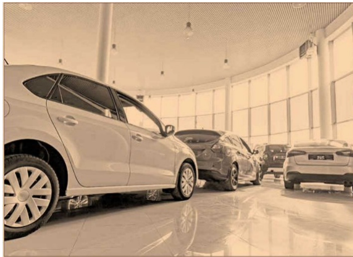
Complicación. Septiembre fue débil en ventas domésticas en EU, debido a que se adelantaron a agosto las ofertas por el Día del Trabajo.