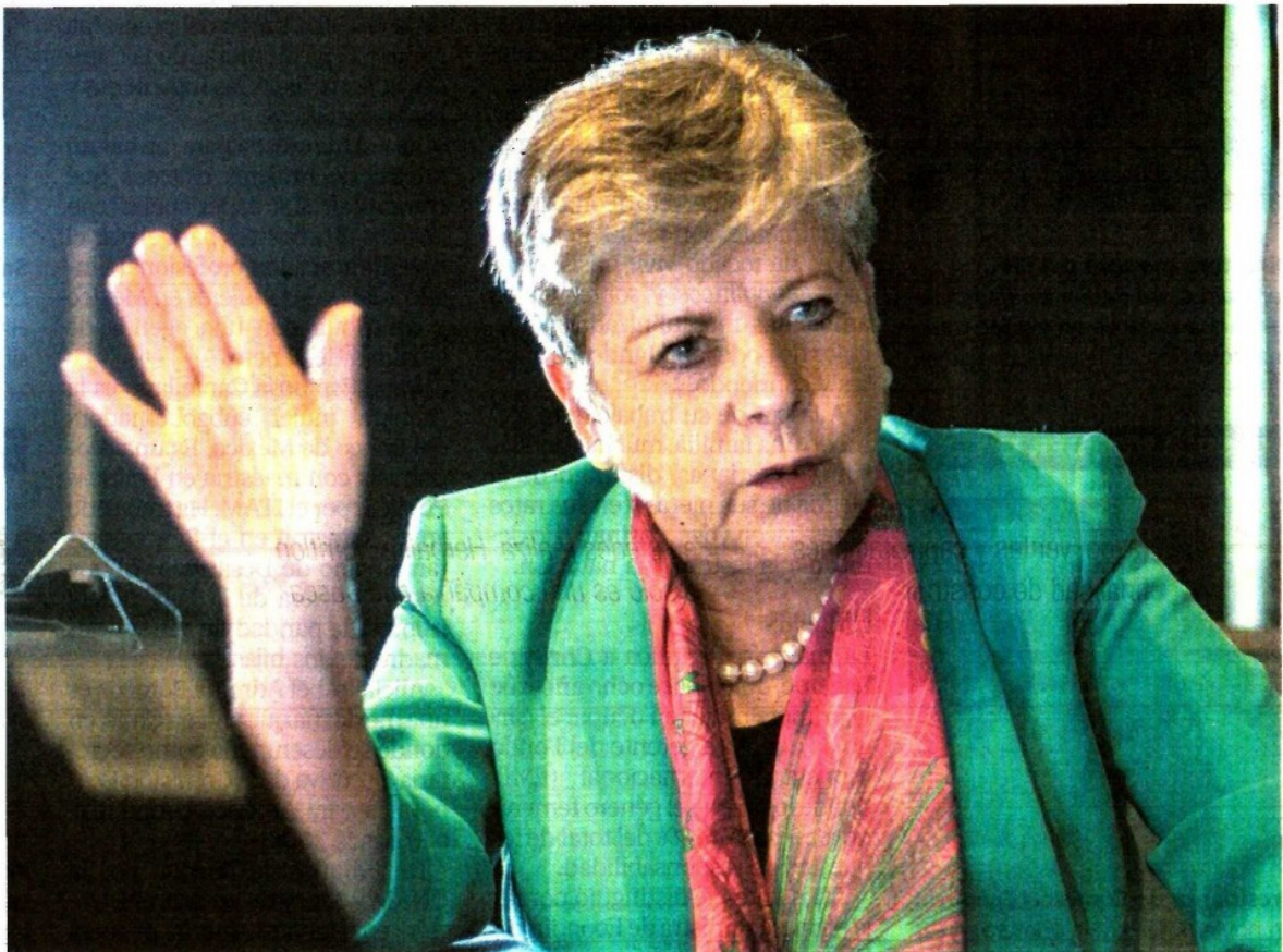
SERGIO TAPIA, EL UNIVERSAL