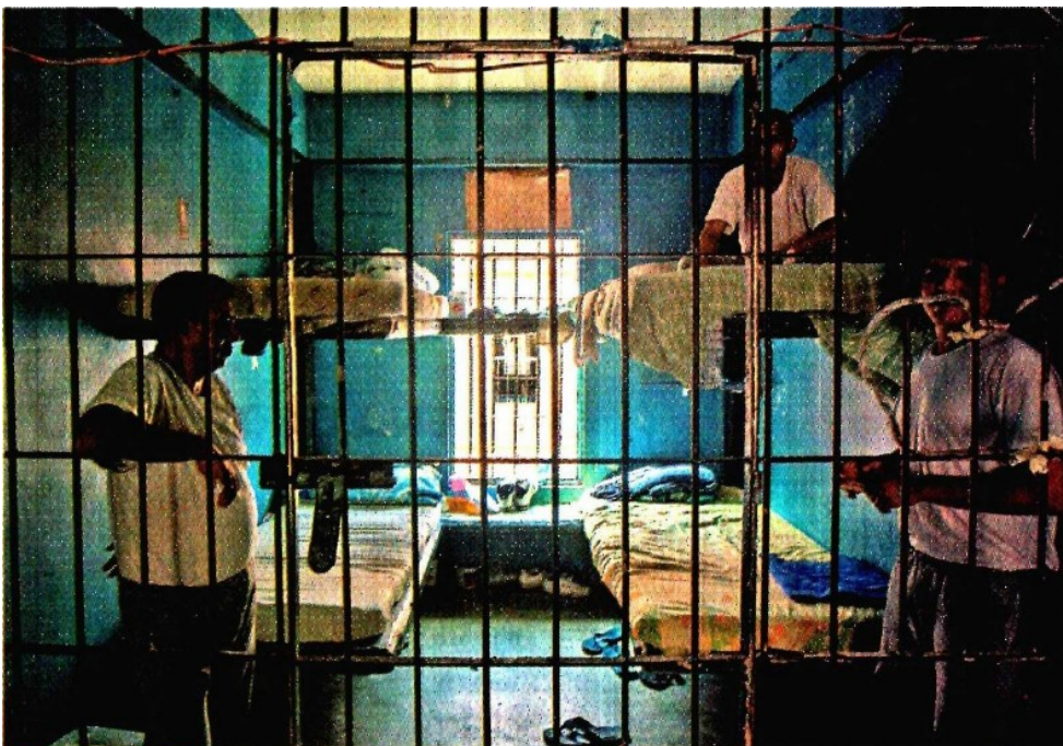
JOSÉ RAMÓN COSSÍO EXMINISTRO DE LA CORTE

Atendiendo al tipo de ilícitos que podrían entrar en la ley sería baja la cantidad de personas que podrán ser amnistiados.”