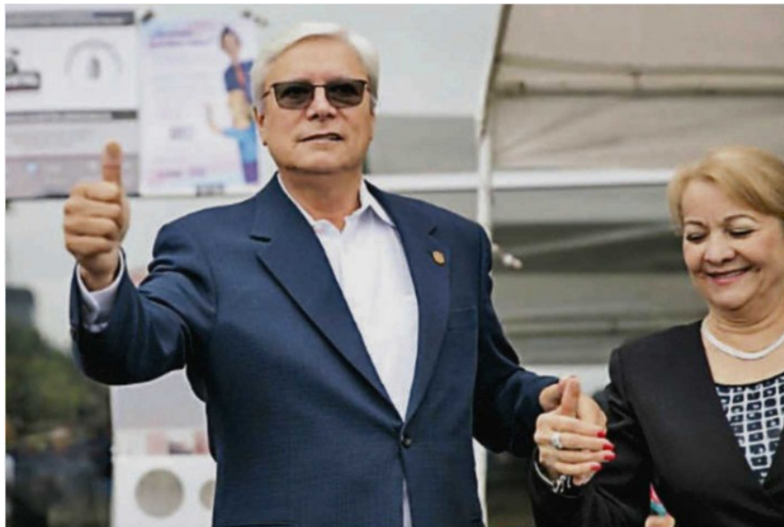
El mandatario electo momentos después de emitir su voto.