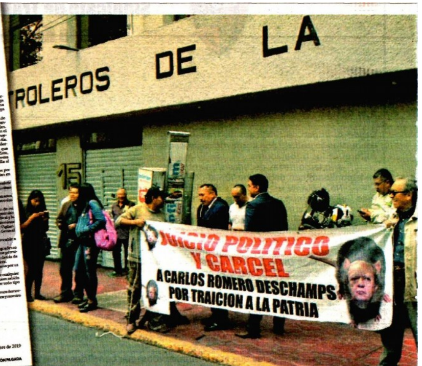
La carta de dimisión del ex dirigente, contra quien hubo protestas ayer afuera de la sede del STPRM. ROMINA SOLÍS. NOTIMEX