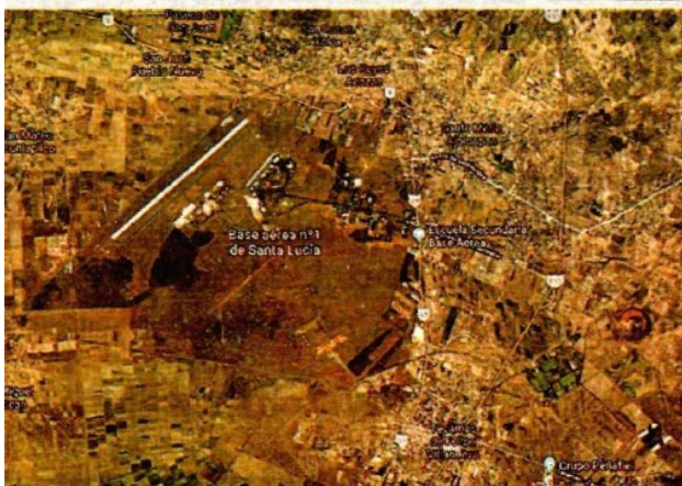
La base militar ya se visualiza en Google Maps. ESEPCIAL