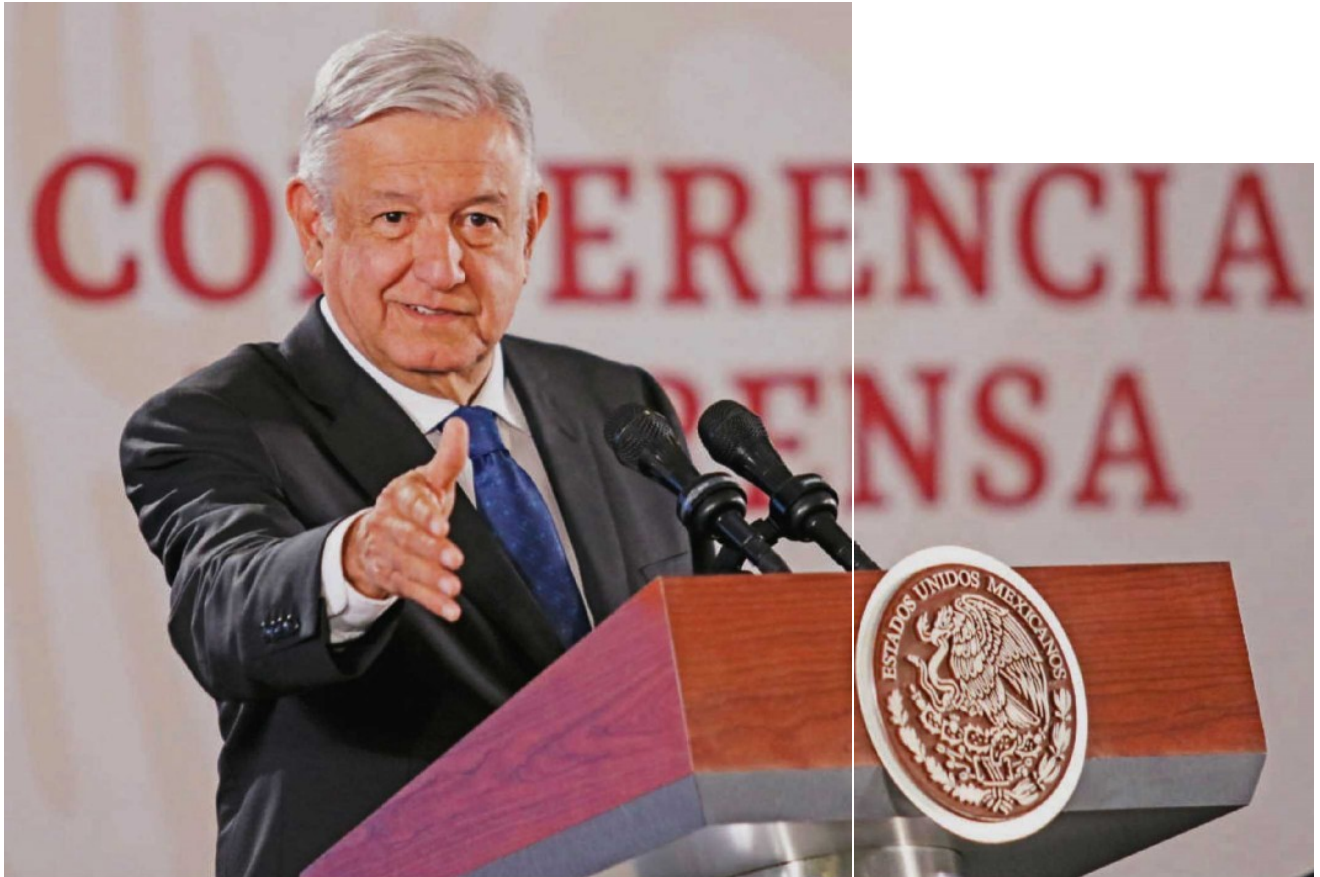
El Presidente durante una conferencia mañanera.

Es necesario que (el Presidente de la República) precise qué tipo de riesgo enfrentamos y de quiénes específicamente"