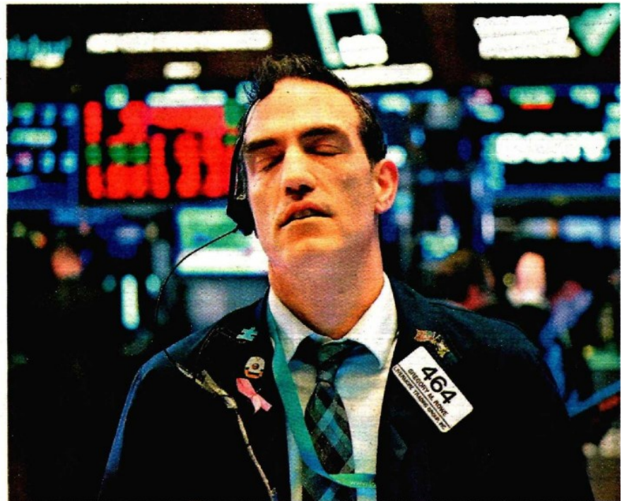
El Dow Jones se hundió 9.99%, su peor caída desde el crash de 1987.

GRÁFICO: Juan Carlos Fleicer