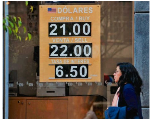
El tipo de cambio peso-dólar alcanzó niveles por arriba de los 21 pesos por unidad. Especial