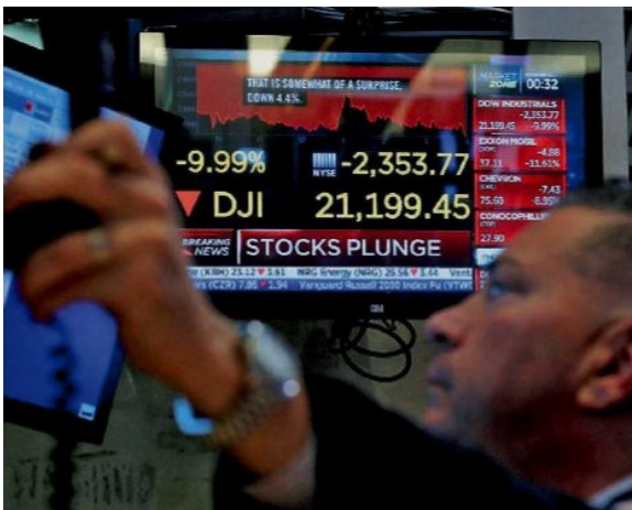
Los mercados bursátiles colapsaron durante los primeros minutos de su apertura.

LA CRISIS petrolera mundial provocada por la guerra de precios provocaron que los bonos de Pemex cayeran a 94 centavos, su nivel mínimo de 2020.