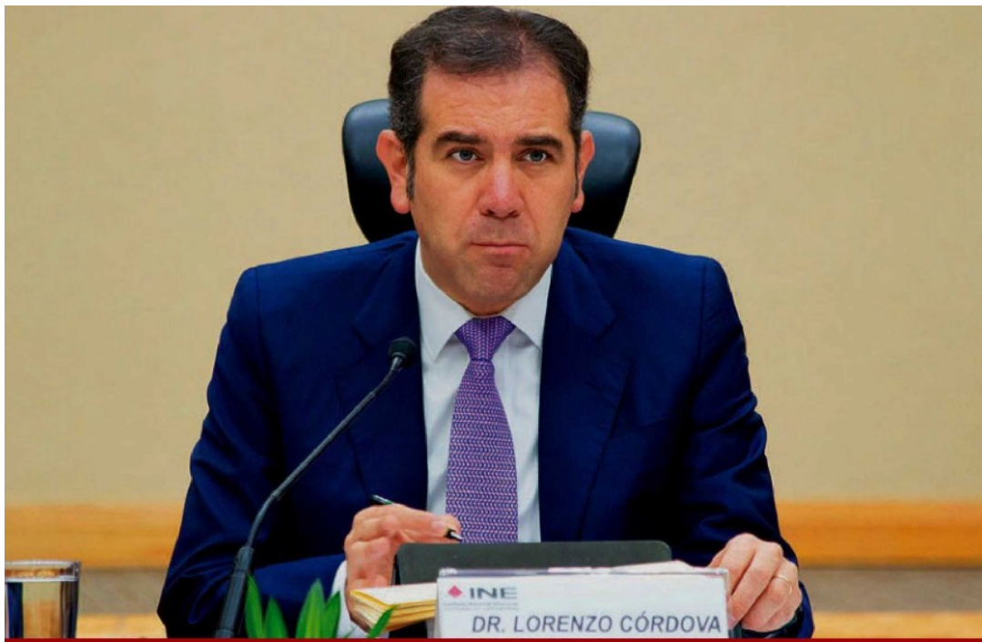
Lorenzo Córdova Vianello, consejero presidente del Instituto Nacional Electoral

Por último, el presidente del INE señaló que el organismo ha abierto diversos expedientes de investigación en contra de servidores públicos de distintos niveles de gobierno y de diferentes partidos, por presuntos actos contrarios a lo marcado en el Artículo 134 durante la emergencia sanitaria, y advirtió que se les dará puntual seguimiento a estos casos.