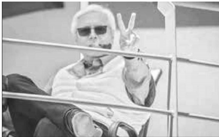
▲ Fumando pipa, el gobernador Jaime Bonilla sostuvo que el ministro Arturo Zaldívar actuó “con el hígado”.