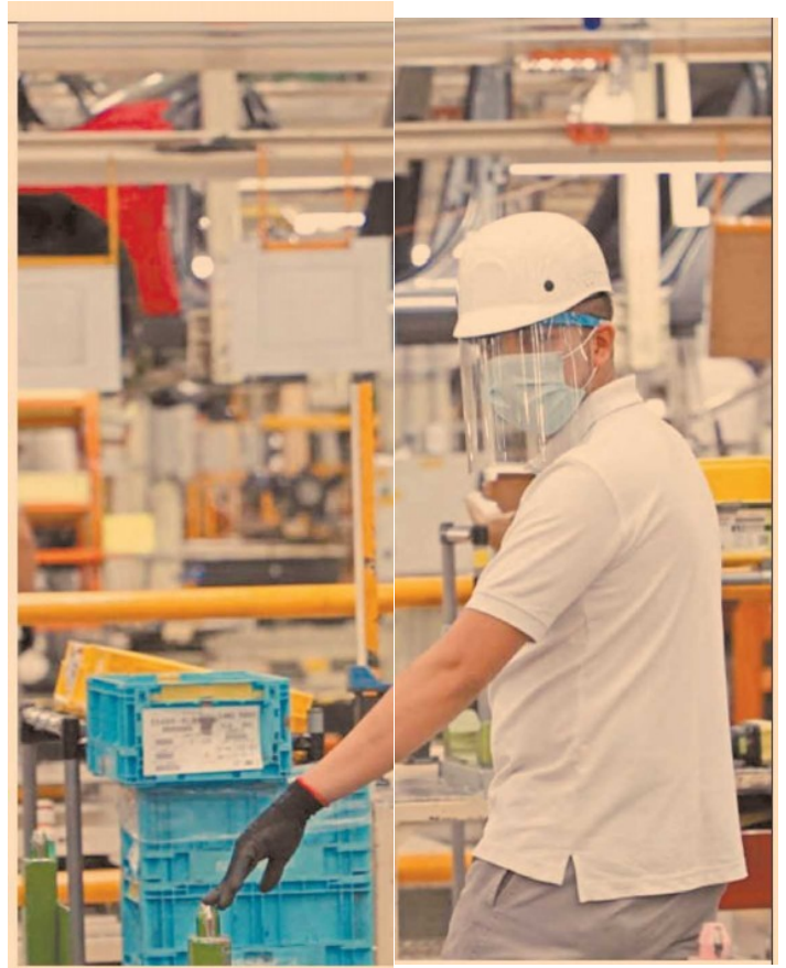
La actividad productiva resintió las medidas de confinamiento.

En términos de niveles, la brusca retracción del índice que mide la variable lo llevó de un valor de 94 a 66.8 puntos en abril, que es el menor nivel desde enero de 1998, cuando se colocó en 66.3 puntos, de acuerdo con los datos publicados por el Inegi.