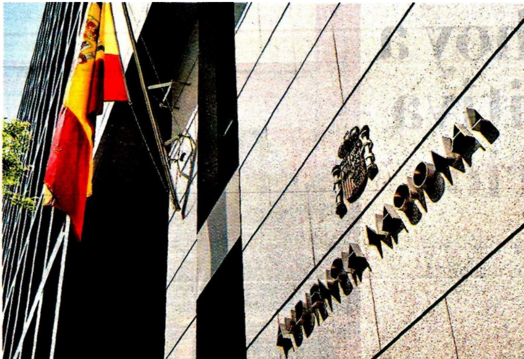
La Audiencia Nacional de España acordó la entrega del ex funcionario a México.

El imputado viajará esposado y bajo custodia de dos agentes mexicanos