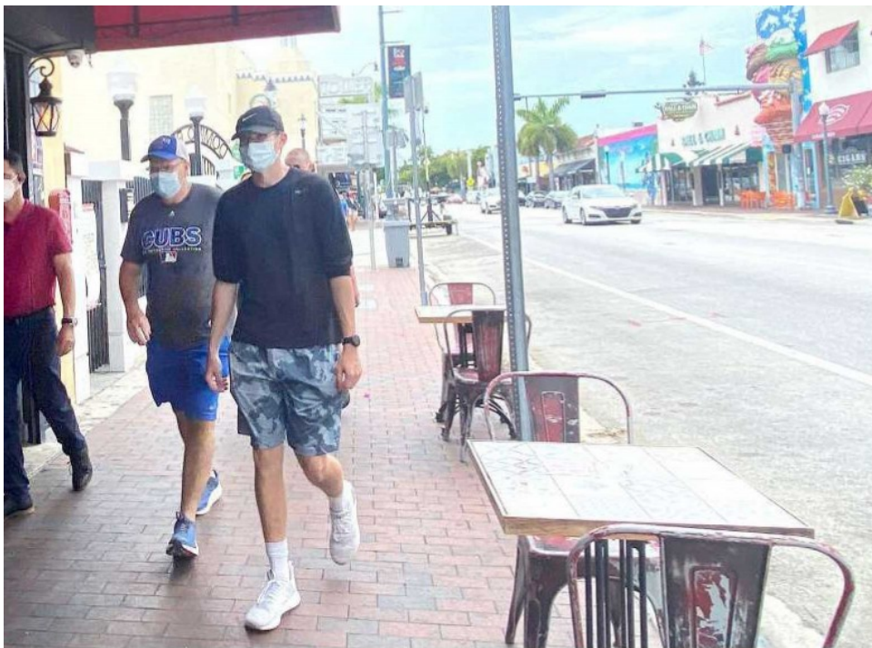
Un anfitrión recibe a los clientes que ingresan a Old's Havana Cuban Bar & Cocina, en el barrio de Little Havana de Miami, Florida, ayer.