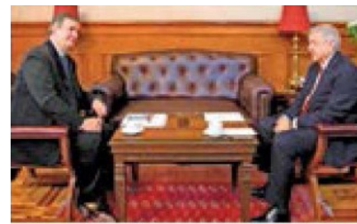
DIPLOMÁTICO. Durante la llamada con Justin Trudeau, el presidente López Obrador estuvo acompañado del secretario de Relaciones Exteriores, Marcelo Ebrard.

A través del mismo medio, Trudeau expresó: “El nuevo TLCAN entró en vigencia la semana pasada, y hoy hablé con el presidente López Obrador sobre cómo el acuerdo fortalece la amistad entre nuestros dos países”.