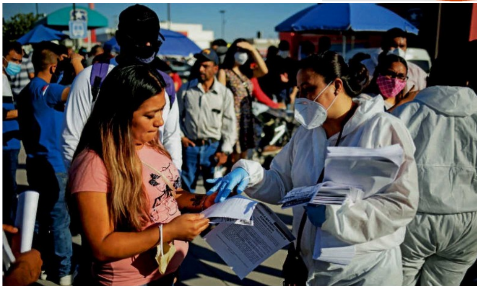
El organismo internacional refiere que el impacto de la pandemia Covid-19 ha sido diez veces mayor en los primeros meses a la crisis financiera de 2008.