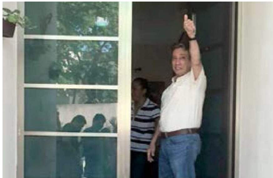
JUZGADO. Mario Villanueva, exgobernador de Q. Roo (1993-1999) fue detenido en 2001 acusado de operar para el Señor de los Cielos.

MARIO VILLANUEVA Ex gobernador de Q. Roo