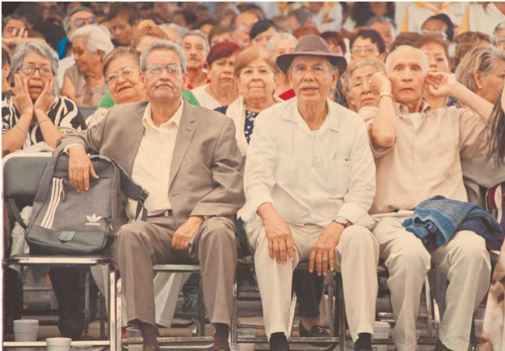
Ciudad de México ostenta el mayor número de pensionados por el IMSS.