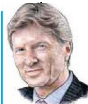
Enrique de la Madrid