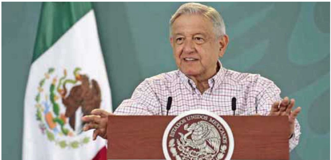
Informe. El presidente rendirá su segundo informe de gobierno el próximo 1 de septiembre.