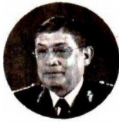
LUIS C. SANDOVAL Secretario de la Defensa

“Con el video que hace unos días salió a la luz, la fiscalía envió personal de la Policía Ministerial Militar a continuar con la indagatoria”