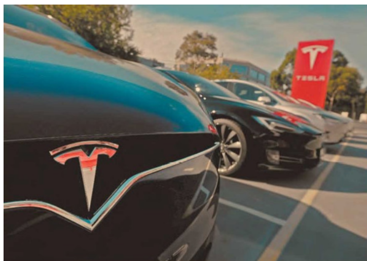
Tesla de Musk, aprovechará su buena racha en el mercado y va por más socios al mercado bursátil.