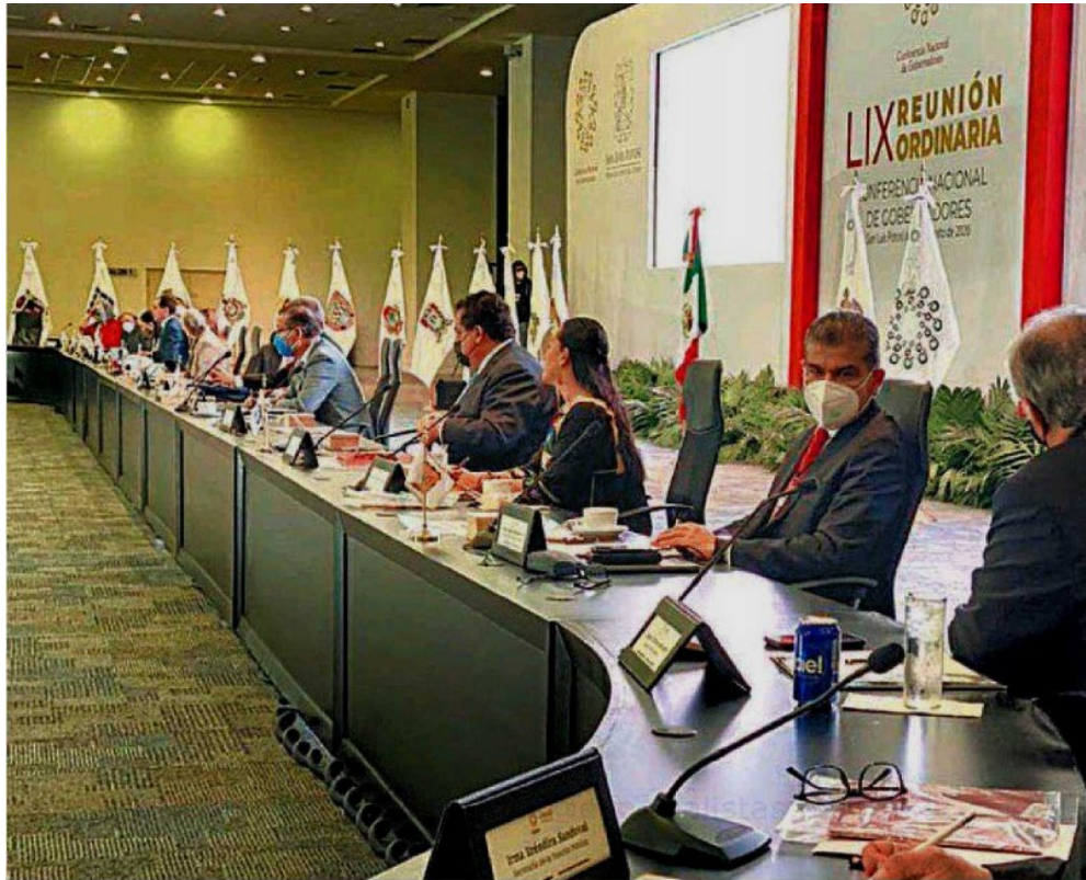
El reciente encuentro de la Conago se celebró en San Luis Potosí