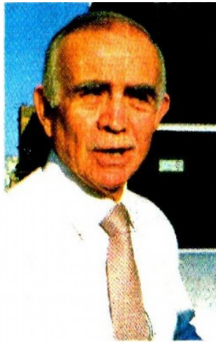
Alfonso Romo, jefe de la Oficina de la Presidencia.