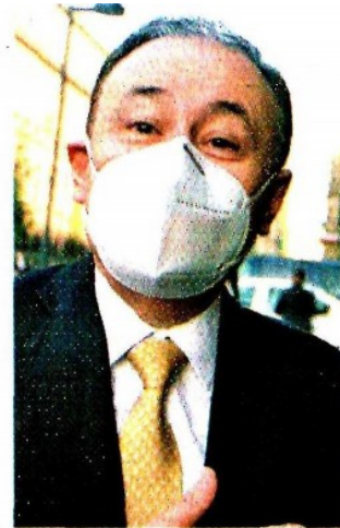
Alfonso Durazo, secretario de Seguridad.