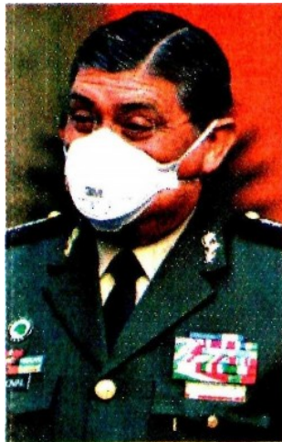
Luis Crescencio Sandoval, secretario de la Defensa Nacional.