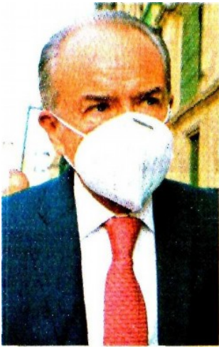
Juan Manuel Carreras, gobernador de San Luis Potosí.