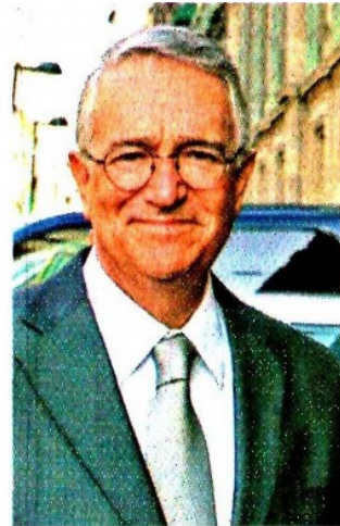
Ricardo Salinas Pliego presidente de Grupo Salinas.