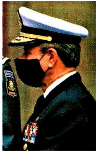
Rafael Ojeda Durán, secretario de Marina.