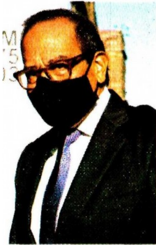
Carlos Salazar Lomelín, presidente del CCE.