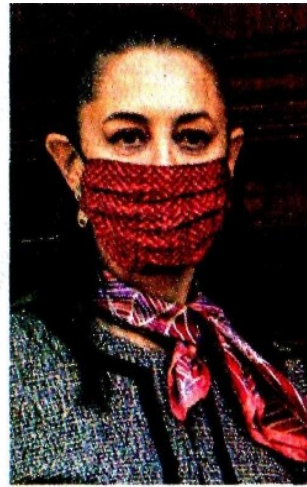
Claudia Sheinbaum, jefa de Gobierno de la CDMX.