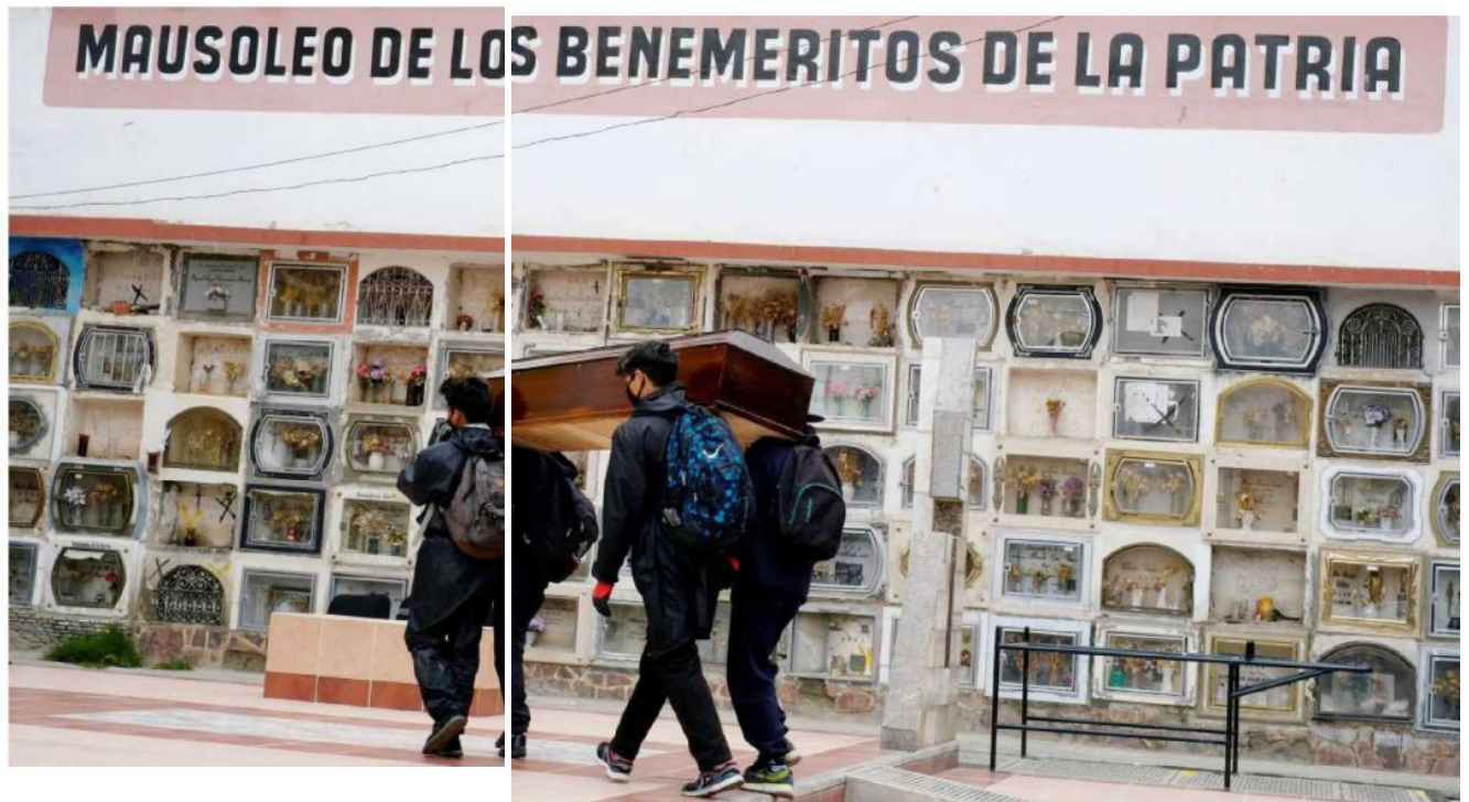
Empleados de la funeraria llevan un ataúd en el Cementerio General, en La Paz, Bolivia, el pasado 2 de septiembre.