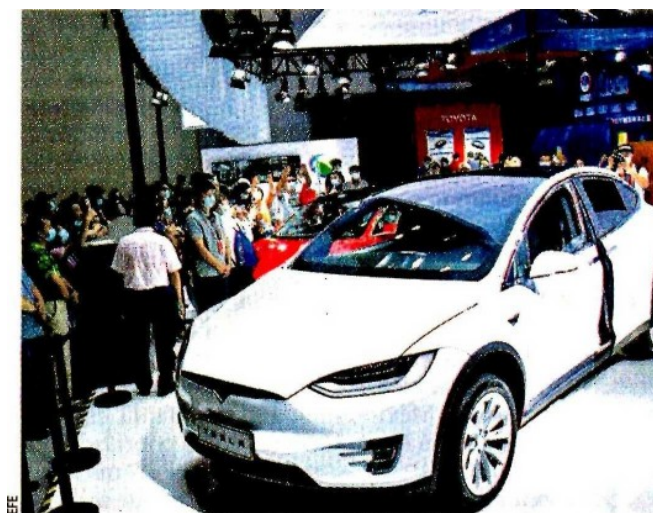
Pese a las bajas recientes, el precio de las acciones de Tesla se ha triplicado en los últimos seis meses.