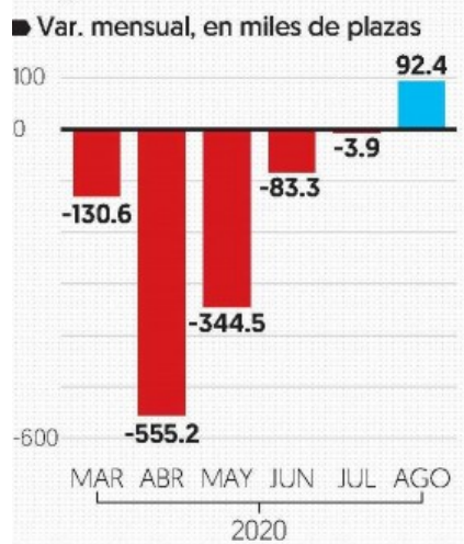
Empleos formales registrados en el IMSS