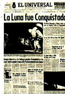
EL UNIVERSAL cubrió la conquista de la Luna.