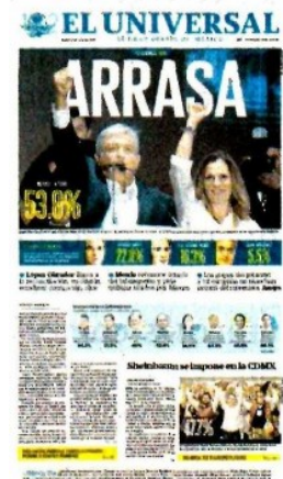
En 2018 registró el triunfo contundente de AMLO.