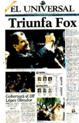
En 2000 no perdió detalle de la derrota del PRI.