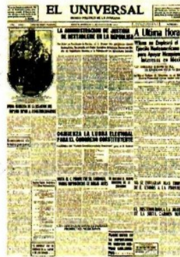
Esta fue la primera portada del diario.

Durante 104 años EL UNIVERSAL siempre ha estado presente en los hechos históricos más importantes del mundo.