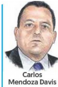
Carlos Mendoza Davis

LA ELIMINACIÓN DEL Fondo Nacional de Desastres llevó a varios gobernadores, especialmente los que integran la Alianza Federalista, a crear un frente común contra el gobierno de la 4T. Tres de los más preocupados: Carlos Joaquín González de Quintana Roo , Enrique Alfaro de Jalisco y Carlos Mendoza Davis de Baja California Sur, entidades que casi todos los años enfrentan tormentas y ciclones. El llamado Fondo fue creado en 1996 con el fin de darle al gobierno federal una estrategia de prevención y gestión de riesgos, ya que México es uno de los países con mayores afectaciones climáticas. El fondo logró apalancar y transferir parte del riesgo en opciones financieras para que la Federación no tuviera que desembolsar cantidades imposibles de predecir en un presupuesto.