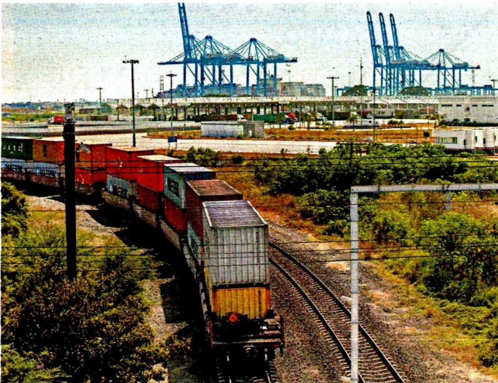
El puerto Lázaro Cárdenas, de los más importantes del país en materia comercial. OMAR FRANCO