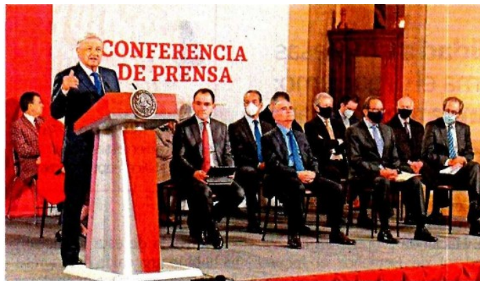
El presidente Andrés Manuel López Obrador acompañado por miembros de su gabinete y empresarios, durante el anuncio.

"La mejor vacuna que tenemos es la inversión privada. Es la esperanza para salir de la crisis, porque representa 80% del total"