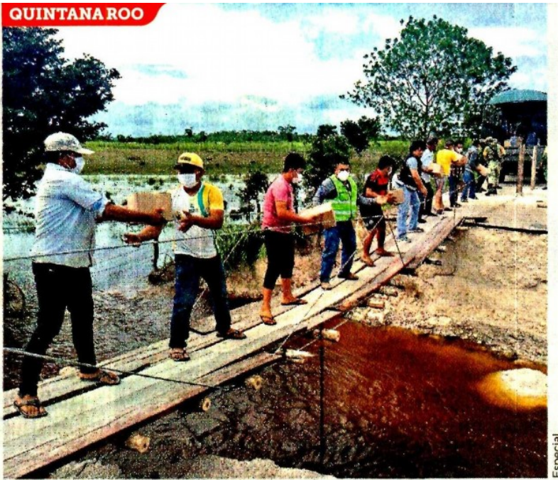
■ La localidad Miguel Alemán, de Bacalar, está incomunicada, por lo que se instaló un puente para entregar víveres.