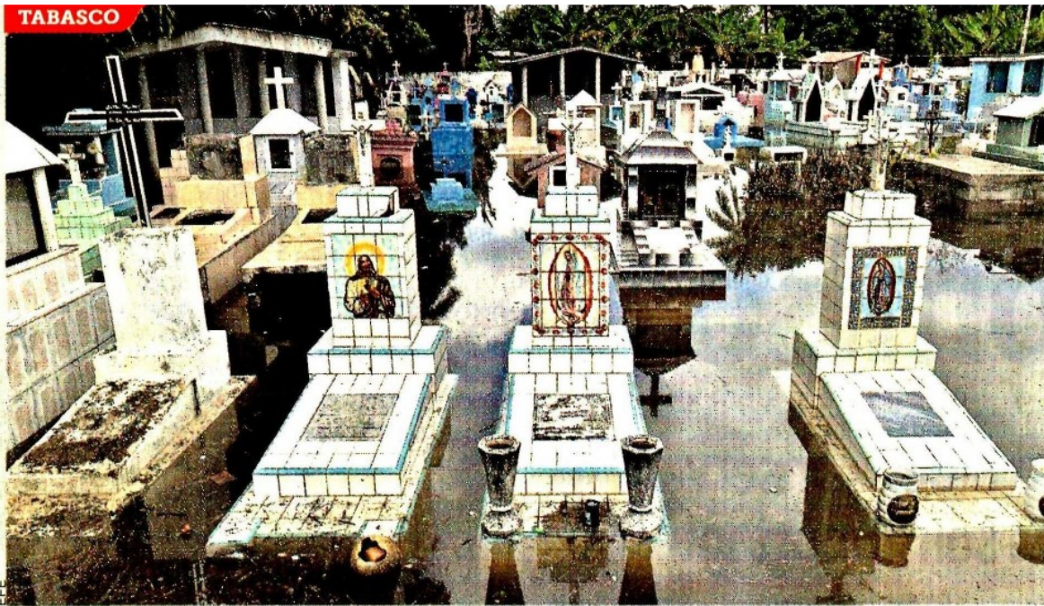
BAJO TIERRA... Y AGUA. El cementerio de la comunidad Gaviotas Sur, en Villahermosa, se vio afectado por el desbordamiento de un río aledaño.

Pese que en los últimos dos días las lluvias dieron un suspiro en el sureste, las afectaciones por "Gamma" y los frentes fríos 4 y 5 son aún visibles.