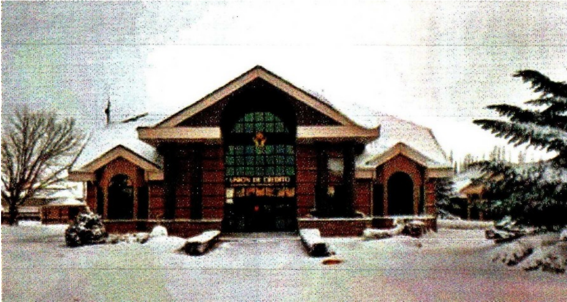
LA UNIÓN ESTÁ FORMADA POR AGRICULTORES, GANADEROS, INDUSTRIALES Y COMERCIALES.