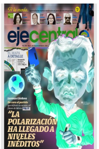
Ilustración: Gilberto Bobadilla para ejeentral