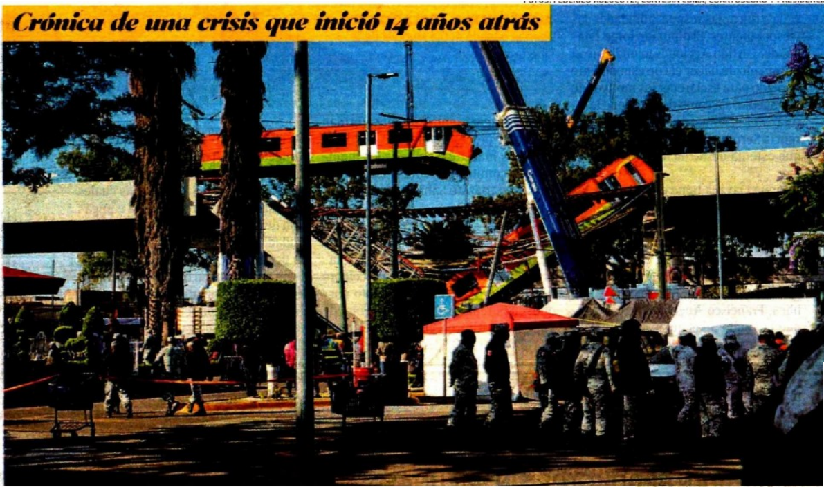
Una grúa retiró ayer los dos vagones en la zona del colapso de la Línea 12, una obra cuyas fallas atraviesan tres administraciones locales

Hasta hace unos días, la directora del Metro asumía también el cargo de subdirectora General de Mantenimiento.