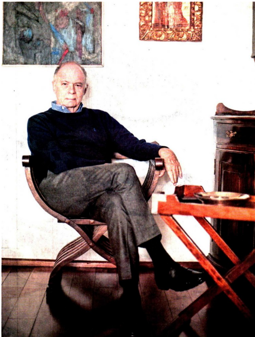
GERMÁN ESPINOSA. EL UNIVERSAL

Un sector de la ciudadanía, en especial las mujeres, está decidido a cambiar de raíz esa situación que conduce a la discriminación, la persecución y al crimen”