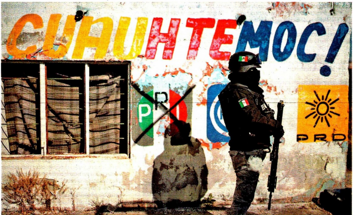
Elemento de la Guardia Nacional vigila en el municipio de Cuauhtémoc.

"Hay otros municipios que incluso también evidencian esa circunstancia. Concepción del Oro tiene solo una puesta a disposición en lo que va del año, esta información es con corte al 12 de noviembre", concluyó el fiscal. —